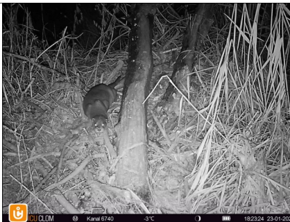
Abb.6: Am 23.01.2026 lief ein Otter in die Fotofalle am Kölpinsee.