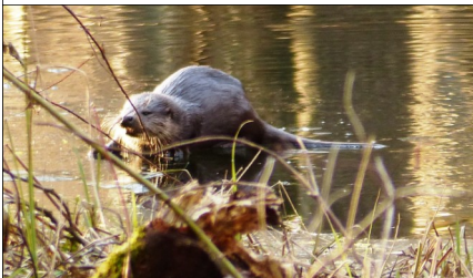
Abb.3: Ein Otter im Bereich der Nebel bei Serrahn am 20.01.2026