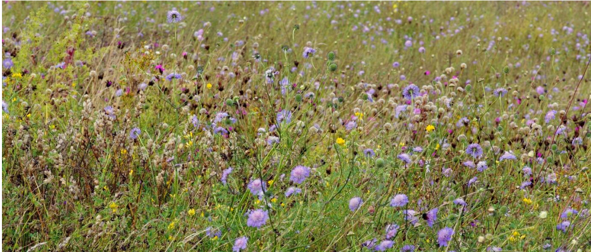
1 Blühende Wiese mit Acker-Witwenblumen, Kartäuser-Nelke, Hornklee

Blühende, artenreiche Wiesen mit heimischen Wildpflanzen bieten Nahrungsgrundlage für viele Insekten und ihre Larven, Vögel und andere Körnerfresser sowie viele Insektenfresser. Sie stellen Nistmaterial, Nistmöglichkeiten sowie Überwinterungsplätze bereit. Blühende Wiesen sind Lebensgrundlage für viele Tiere.