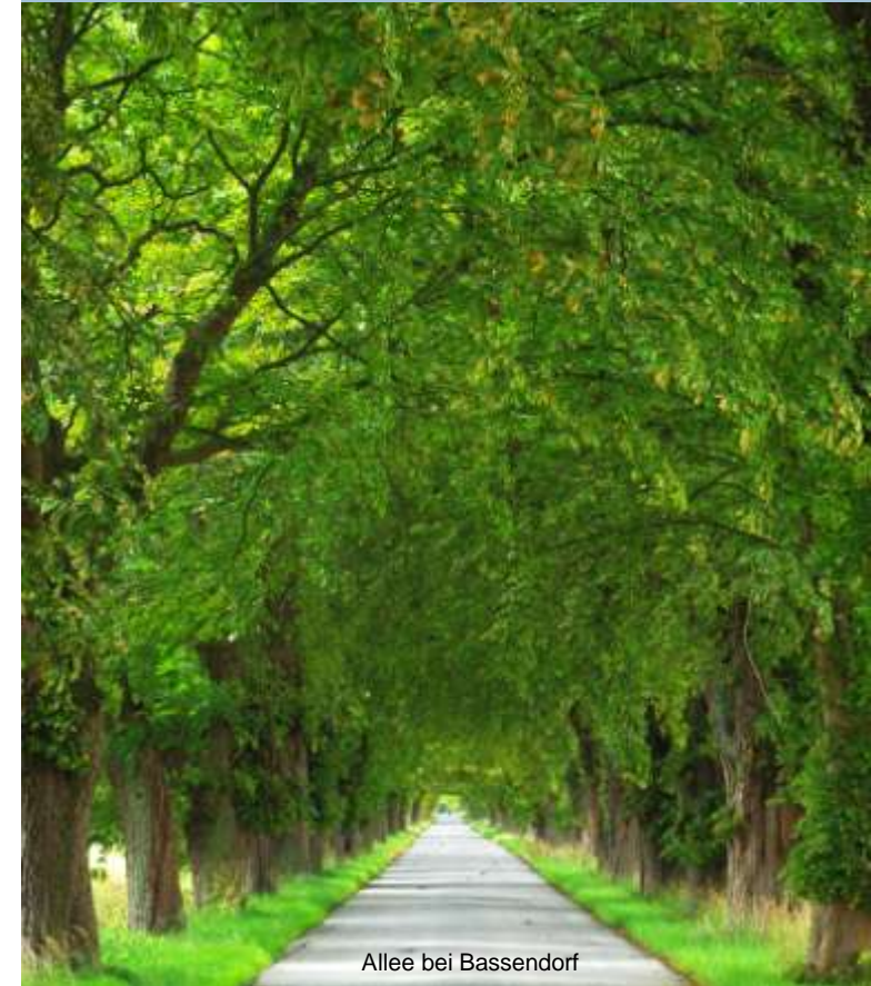
Allee bei Bassendorf

11. Fachtagung des BUND Mecklenburg-Vorpommern in Kooperation mit dem LUNG M-V 4. November 2015 in Güstrow